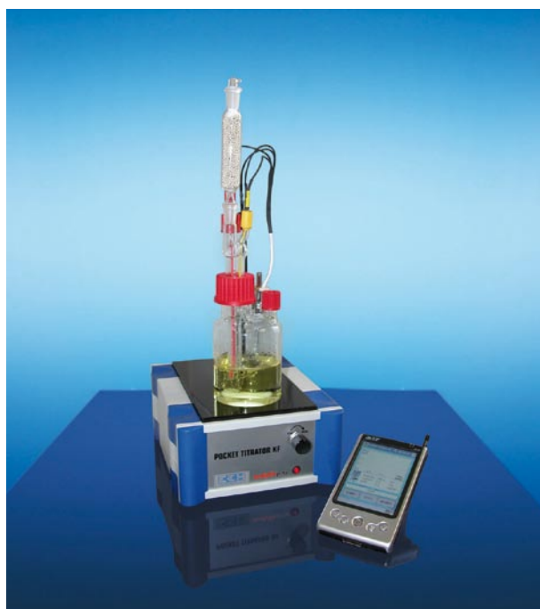
▲ Pocket-Titrator mit platzsparendem PDA

Analytik Jena AG Konrad-Zuse-Str. 1 07745 Jena / Germany